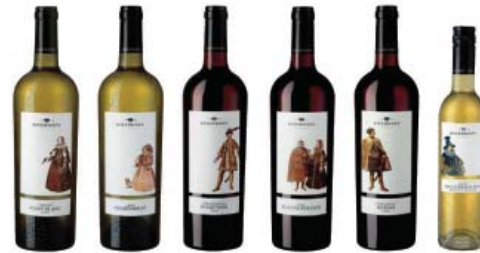
ESTERHÁZY Single Cru